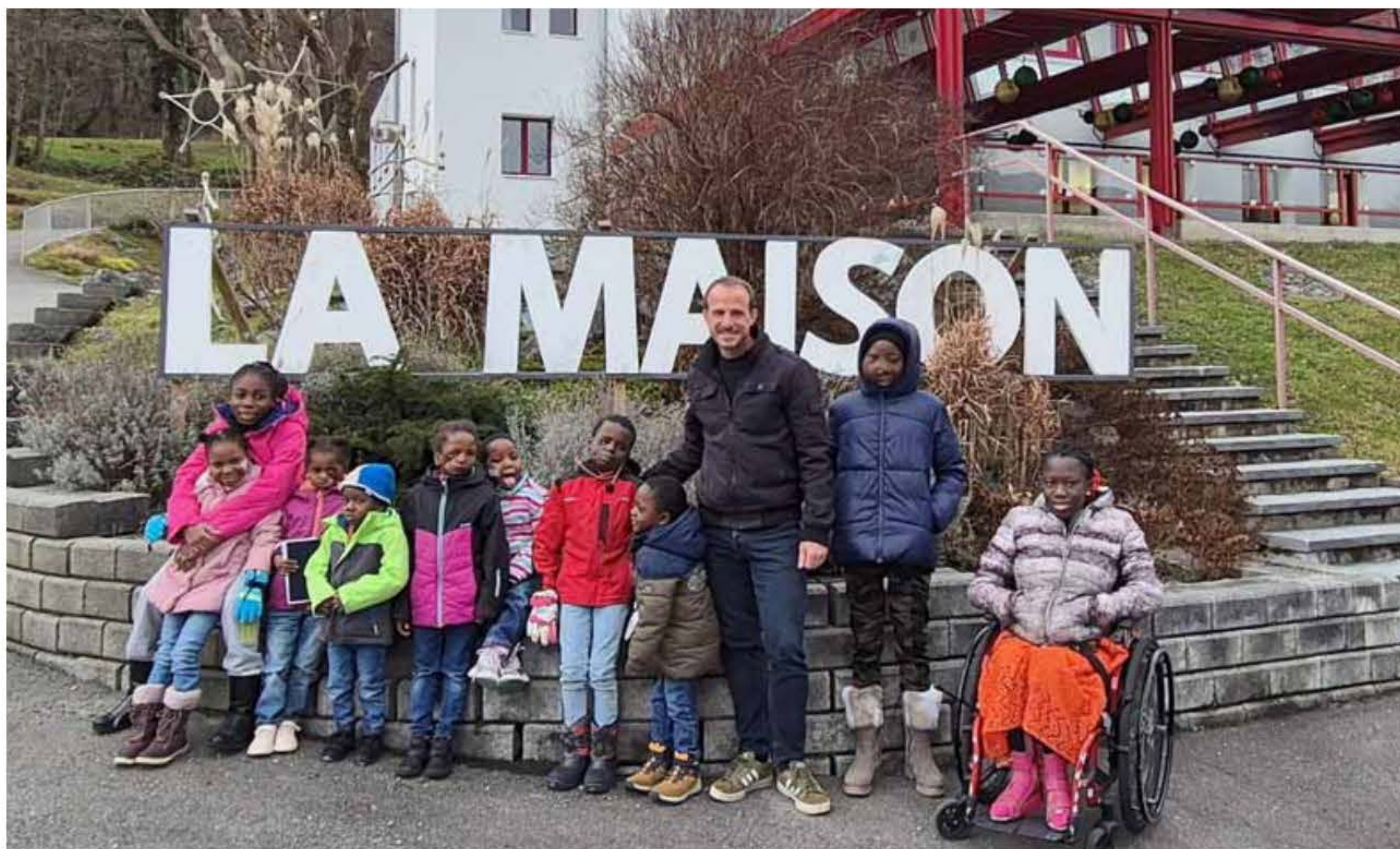
Le futur directeur entouré d'enfants dans la maison de Terre des Hommes.