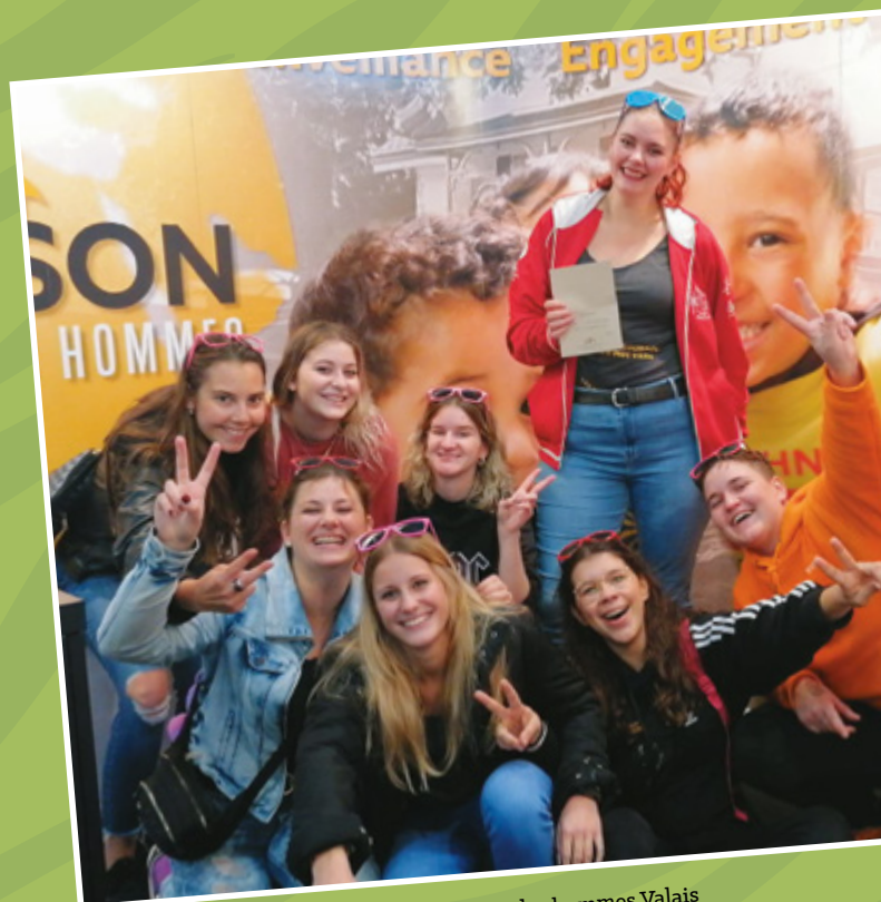
L'ambiance conviviale sur le stand de Terre des hommes Valais

Plusieurs autres événements ponctuels organisés en collaboration avec nos partenaires présents à la Foire viendront marquer notre anniversaire tout au long de la semaine. Notre traditionnelle tombola sera également organisée sur notre stand. Tous les lots sont offerts par de généreux donateurs. Nous les remercions chaleureusement