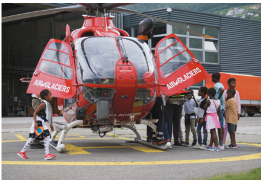
Découverte d'un hélicoptère de sauvetage pour les enfants de La Maison