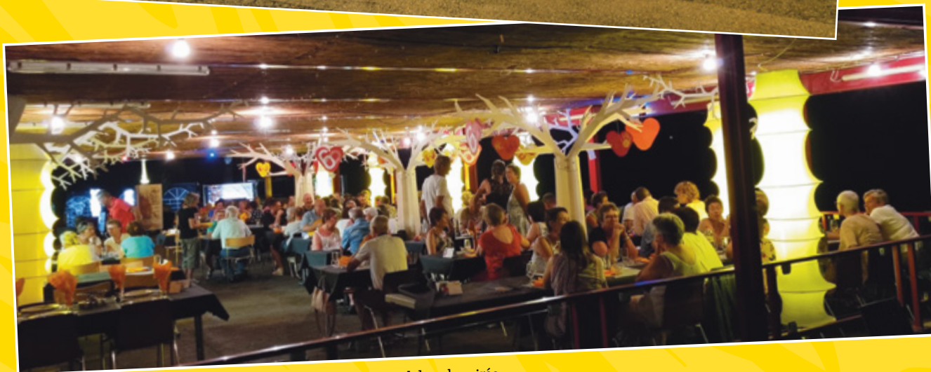
L'ambiance chaleureuse a gardé les tablées vivantes jusqu'à tard dans la soirée.