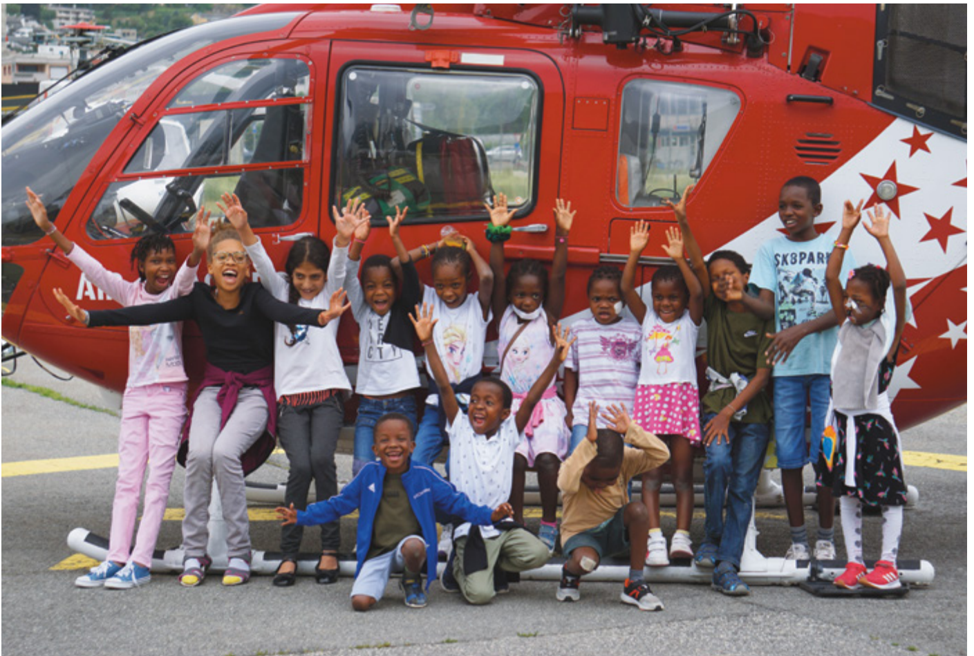
Les enfants ont passé une matinée riche en émotions

Le 22 juin dernier, les enfants ont vécu une expérience extraordinaire en visitant le siège de la compagnie de sauvetage Air-Glacières. Ils ont beaucoup appris sur le travail essentiel réalisé par les professionnels du sauvetage, qui interviennent parfois à La Maison quand un enfant doit être transféré en urgence à l'hôpital. Cette journée restera gravée dans leur mémoire. L'occasion également pour Terre des hommes Valais de renforcer ses liens avec ce partenaire important.