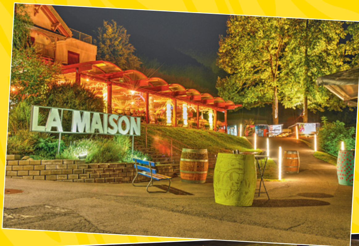
Les soirées se sont déroulées dans une ambiance chaleureuse dans les jardins de La Maison.

En cette année marquant les 60 ans de Terre des hommes Valais, les Rencontres Estivales resteront gravées dans nos cœurs. Nous vous donnons rendez-vous l'année prochaine pour une nouvelle édition.